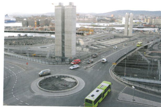
Ingen byfornorskjønnelse - vi vil ha lyskunst!